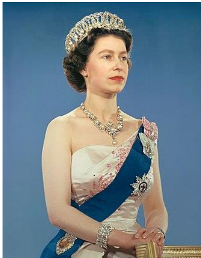
1959年以英國君主身份拍攝的官方肖像